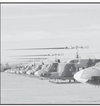
کردستان هم نبود».

بالگردهای ترابری هواینروز در تمامی شرایط آقندی و پدافندی در جابجایی فرماندهان، حمل تدارکات و نیرو در دشت‌های وسیع خوزستان تا مناطق صعب‌العبور غرب و شمالغرب نقشی ماندگار ایفا نمودند که بیان هر یک از آنها در این مجال امکان پذیر نیست، و به همین دلیل تنها به چند عملیات برجسته و گوشه‌ای از فعالیت‌های