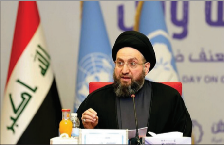
تلاش های بشردوستانه تأکید کرد و خواستار کمک رسانی با روندهای مختلف از طریق مجاری رسمی و غیر رسمی شد.

رسمی شد. رئیس جریان حکمت ملی عراق تلاش های دولت عراق، عتبات مقدسه و نهادهای سیاسی و اجتماعی که به فراخوان مرجعیت عالیقدر دینی در امدادسانی لیبیک گفتند علاوه بر مشارکت مؤثر ملت عراق در این زمینه را تحسین کرد. حکیم خواستار برگزاری نشست های سازمان همکاری اسلامی، اتحادیه عرب و همه سازمان های بین المللی با هدف فشار برای توقف جنگ، اجرای قوانین و مصوبات بین المللی و مفاد مشروعیات بین المللی بر رژیم غاصب اسرائیل شد. تلاش های بشردوستانه تأکید کرد و خواستار کمک رسانی با روندهای مختلف از طریق مجاری رسمی و غیر رسمی شد.