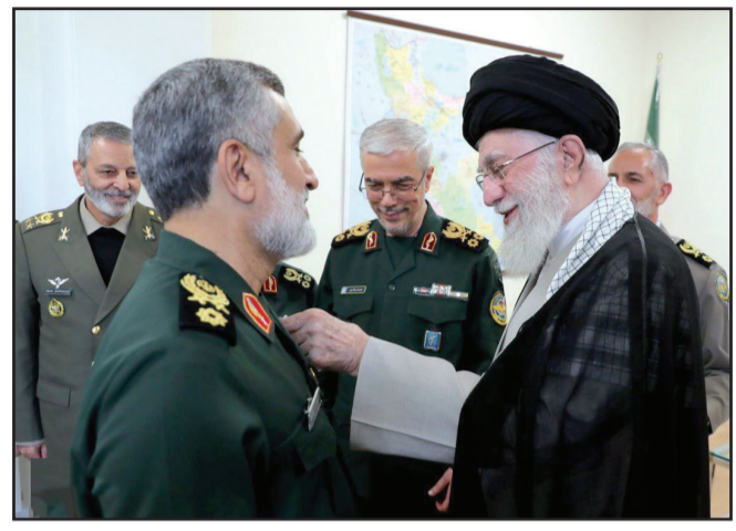
رهبر انقلاب «نشان فتح» را به سردار حاجی زاده فرمانده هوافضای سپاه اعطا کردند

شهرهای بزرگ جهان در سالگرد جنایت اسرائیل در غزه شاهد برگزاری تظاهرات ضد صهیونیستی بود