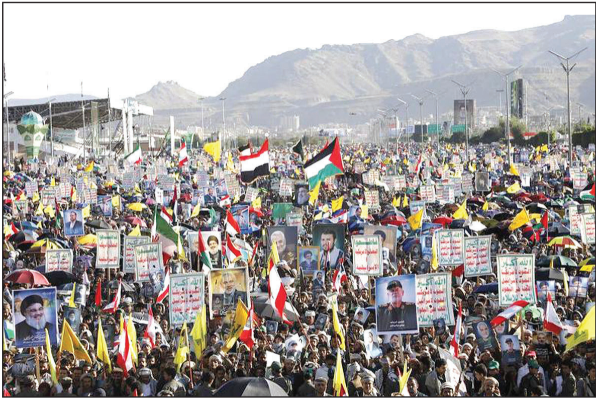
پادشاه اسپانیا: ویرانی در غزه غیر قابل توصیف است، جنگ متوقف شود

تظاهرات کنندگان خواستار اقدام کشورهای غربی و سازمانهای بین المللی در کنترل افسار گسیختگی رژیم صهیونیستی شدند