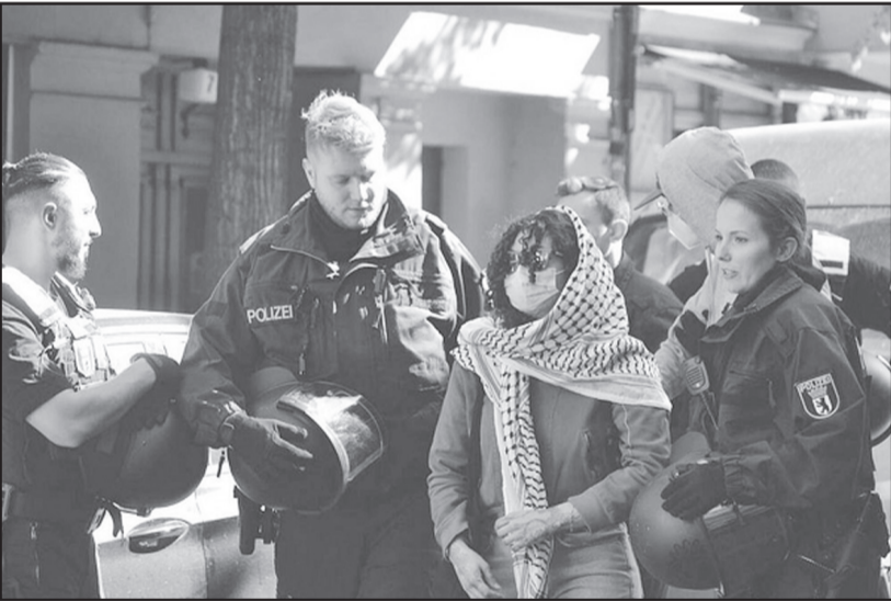
نسل‌کشی علیه فلسطینی‌ها در نوار غزه و کرانه باختری اعلام کرده است.

پایان انجام کار منتشر نمی‌شود. پلیس آلمان ادعا کرده است، برخی از این افراد در تخریب اموال عمومی کشور و همچنین برخورد نادرست با پلیس نیز نقش داشته‌اند. پنج نفر فرد بازداشت شده ازسوی پلیس آلمان شامل یک جوان، ۱۸ ساله، ۲۰ ساله، ۲۵ ساله، ۳۱ ساله و ۴۰ ساله می‌شوند. یکی از دلایل دستگیری افراد مذکور شعارهایی بوده است که آنها در حمایت از حقوق مردم فلسطین سر داده‌اند و اکنون ازسوی پلیس آلمان به دلیل سر دادن چنین شعارهایی به محکوم به ایده ترویج نابودی رژیم اسرائیل شده‌اند. گفته می‌شود پلیس در جریان این حملات، تلفن همراه، رایانه و سایر وسایل الکترونیک متهمان بازداشت شده را نیز مصادره کرده است. اقدام پلیس آلمان با هدف خاموش کردن صداهای حامی فلسطین در این کشور و متهم کردن آنها به تروریسم و یهودستیزی صورت