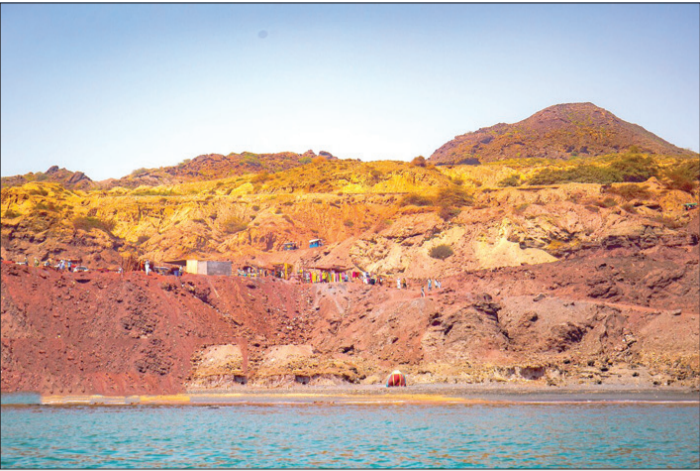
جزیره هرمز، نگین خلیج فارس در ۸ کیلومتری بندرعباس است.

سرکلانتر ششم پلیس پیشگیری تهران از دستگیری اعضای باند سارقان منازل در جنوب تهران خبر داد. به گزارش رکتا، سرهنگ رسول بهرامی در این باره گفت: پیرو وقوع یک فقره سرقت منزل در محدوده کلانتری ۱۱۴ غیاثی، تیم عملیات این کلانتری با حضور در محل سرقت، تحقیقات خود را آغاز کردند. وی افزود: با بالایش اطلاعات به دست آمد مشخص شد که سرقت توسط راننده و ۲ سرنشین یک دستگاه خودرو اتفاقی افتاده است. سرکلانتر ششم پلیس پیشگیری تهران با بیان اینکه ماموران با استفاده از شیوه‌های نوین کشف جرم مخفیگاه اعضای این باند را در محدوده همین سر کلانتری شناسایی کردند ادامه داد: با هماهنگی‌های قضائی تیمی از ماموران کلانتری به مخفیگاه متهمان اعزام و با اطمینان از اینکه هر سه متهم در مخفیگاهشان حضور دارند هر سه سارق را دستگیر کردند. وی در ادامه گفت: در این عملیات پلیسی علاوه بر دستگیری متهمان در بررسی‌های بیشتر از مخفیگاه متهمان تعدادی اموال مسروقه از قبیل ۲ عدد تلویزیون، یک دستگاه تلفن همراه مسروقه، جارو برقی، مقداری طلا و ۳۰ گرم مواد مخدر کشف شد. سرکلانتر ششم پلیس پیشگیری تهران همچنین به اعتراف متهمان به ۱۰ فقره سرقت با همکاری یکدیگر اشاره کرد و افزود: کنون ۲تن از مال باختگان شناسایی و تحقیقات پلیسی کماکان ادامه دارد.