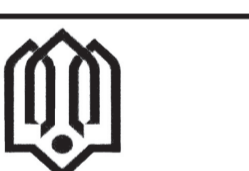
سازمان نوسازی، توسعه و تجهیز مدارس کشور اداره کل نوسازی، توسعه و تجهیز مدارس استان تهران

مدیرعامل آبقای آستان فارس ادامه داد: در این طرح آبرسانی که با هزینه افزون بر ۶۵۰ میلیارد ریال آماده بهره‌برداری شده است، یکجک تصفیه آب از نوع فیلتر شنی با دبی خروجی ۶۰ لیتر بر ثانیه طراحی و نصب شده است که آب آشامیدنی روستاهای بخش قطرویه، شامل ۹۵ روستا و آبادی، با جمعیت ۱۲ هزار نفر در قالب ۲۸۰۰ خانوار را از محل سد چشمه عاشق تأمین می‌کند.