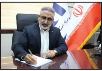
ظرفیت‌های بیشتر است.

وی ادامه داد بانک صادرات در راستای عمل به منویات مقام معظم رهبری در خصوص توجه و حمایت هرچه بیشتر از اقتصاد دریا محور و اجرای سیاستهای دولت محترم در استان هرمزگان اقدام به انعقاد تفاهم نامه با سازمان بنادر و دریا نوردی ایران در خصوص تعمیر و ساخت شناورهای