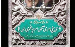
منتهای ایران‌های شهری اصیل