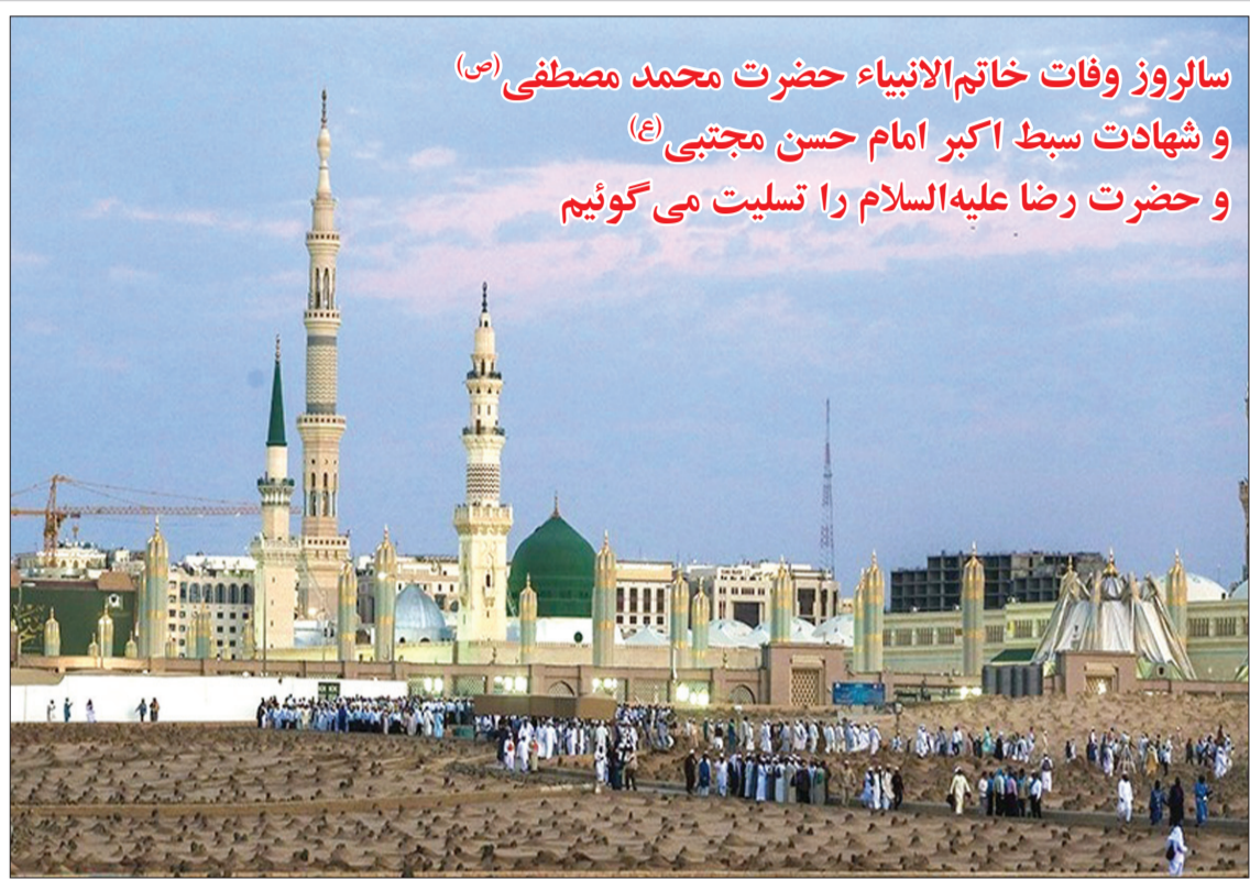
سالروز وفات خاتم‌الانبیاء حضرت محمد مصطفی (ص) و شهادت سبط اکبر امام حسن مجتبی (ع) و حضرت رضا علیه‌السلام را تسلیت می‌گوئیم