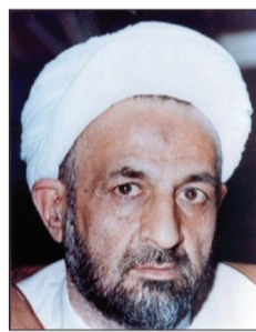
الگوی علم و عمل *به مناسبت ایام شهادت آیت‌الله قدوسی