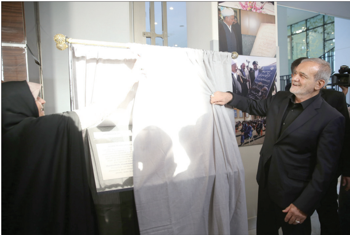
رئیس جمهور پزشکیان: بی تردید خدمات و زحمات ماندگار مرحوم آیت الله هاشمی رفسنجانی باید مورد ارج گذاری و قدردانی قرار گیرد