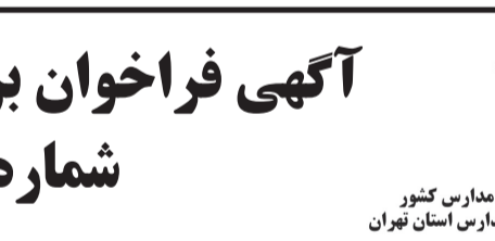
سازمان نوسازی، توسعه و تجهیز مدارس کشور

وی افزود: برای اینکه شاهد بی‌نظمی نباشیم باید بسترها و ساختارهای لازم را ایجاد کنیم تا شهروندان را با اطلاع‌رسانی درست به رفتار درست اجتماعی ترغیب کنیم تا دیگر در بحث املاک و اموال غیرمنقول شاهد بی‌نظمی و شاهد آن شرایطی که منجر به شکل‌گیری فساد می‌شد نباشیم. با این هدف ما زیرساخت‌ها را آماده می‌کنیم و در ادامه انقُلت نیاوریم و در سامانه رفتار خود را شکل دهیم.