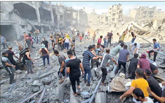
در جریان حمله به بیمارستان در غزه، کشته‌شدگان را در زیر آوارهای تخریب‌شده پیدا می‌کنند.

«اسکای نیوز” عربی در خصوص جزئیات مذاکرات بین حماس و اسرائیل می‌گوید که حماس خواستار آزادی مروان البرغوثی، از رهبران جنبش فتح، در مرحله اول معامله تبادل شده است. این رسانه افزود: از استقبال بغداد از بیانیه قطر، آمریکا و مصر برای برقراری آتش‌بس در غزه خبر داد. وزیر خارجه لبنان نیز حمایت خود را از بیانیه سه‌جانبه درباره مذاکرات پیرامون معامله تبادل اسرا و آتش‌بس در غزه اعلام کرد. «عبدالله بوحبیب» وزیر خارجه لبنان اظهار داشت: دولت لبنان از بیانیه مشترک «جو