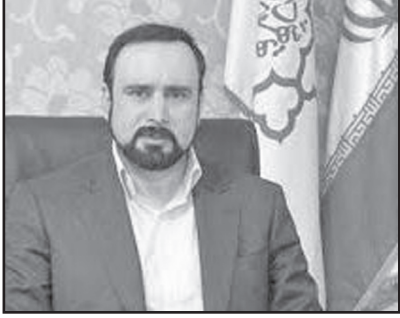
شهردار کرمانشاه، علی‌رضا سعیدی

وی گفت: با برنامه‌ریزی صورت گرفته و با توجه به وضعیت هر منطقه و منابع درآمدی برای آن منطقه، سهم درآمدی تعیین شده است که مدیران درآمدی و شهرداران مناطق موظف به تحقق حداقل ۸۵ درصد آن هستند، از این رو وظیفه مدیران درآمدی سنگین‌تر از گذشته است چرا که نمود تلاش‌های آنها را می‌توان در ارائه خدمات باکیفیت و بیشتر به شهروندان ملاحظه کرد.