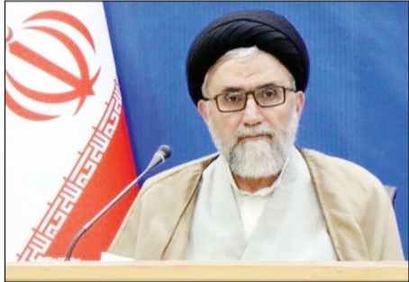
پزشکیان در جریان دیدار با رهبران جنبش دانشجویی ایران

بنابراین، افسرد بی‌تجربه و کسانی که به صورت دستوری عمل می‌کنند، از این تعریف خارجند و نمی‌توانند برای کشور مفید باشند.