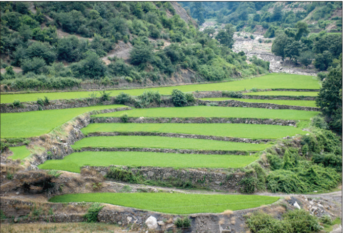
زمین‌های کشاورزی در استان گلستان