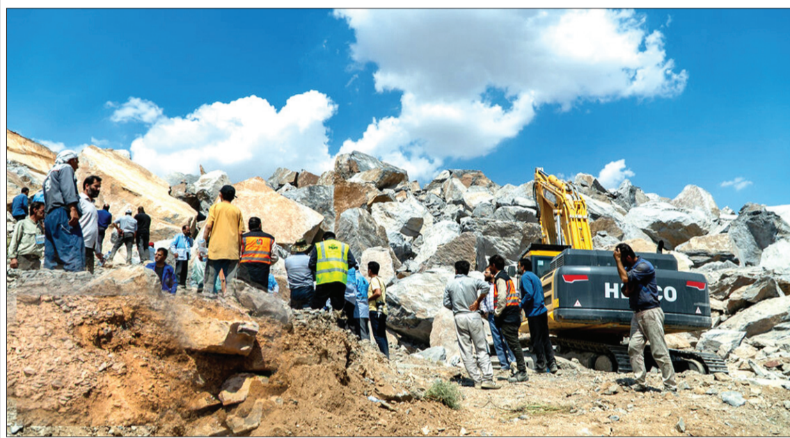
ریزش معدن در شازند استان مرکزی با ۴ کشته و مفقودی

ناتو در حال مذاکره با کشورهای عضو است تا کلاهک‌های هسته‌ای خود را برای مقابله احتمالی با روسیه و چین به حالت آماده‌باش قرار دهند. به گزارش خبرگزاری اسپوتنیک، کشورهای ناتو درحال مذاکره برای درحالت آماده‌باش قرار دادن کلاهک‌های هسته‌ای اما این اقدامات به گواه کارشناسان بین‌المللی نتوانسته است. ینس استولتنبرگ، دبیرکل اتحادیه اروپا به تلگراف گفت که مشورت‌ها در این خصوص جریان دارد ولی مشخص