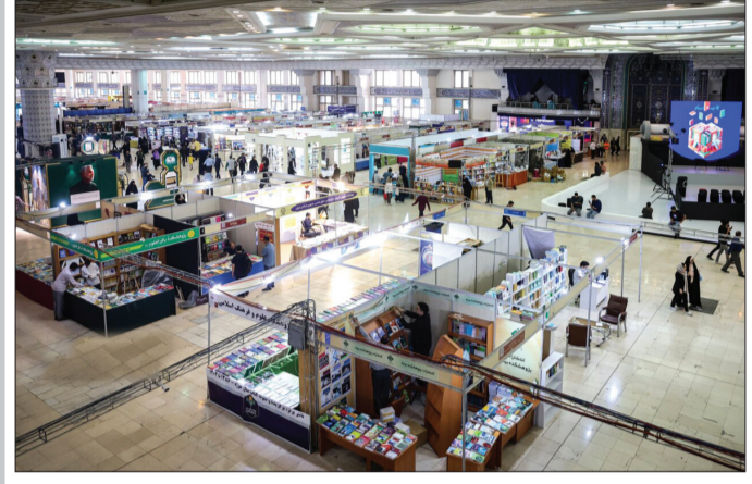
آغاز به کار سی و پنجمین نمایشگاه بین‌المللی کتاب تهران

رئیس جمهور در جشن دختران آرمانی: نگاهی که می‌خواهد زن را از نقش آفرینی در جامعه جدا کند قبول نداریم