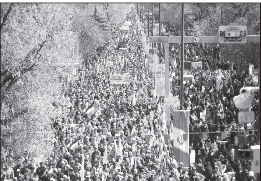
همدان- خبرنگار روزنامه جمهوری

اسلامی: راهپیمایی امسال روز جهانی قدس مردم فهیم استان همدان نما و نمود دیگری داشت، حضوری متفاوت همراه با شور و شعور و ادای احترام و همراهی تمام قد با آرمان شهدای جبهه مقاومت از یک سو و خشم و انزجار از وحشی گری افسار گسیخته رژیم‌ی خونخوار و همچنین نفرت از سیاست‌ها و موضع گیرهای یک بام و دوهوای مدافعان به اصطلاح حقوق بشر اروپایی و آمریکایی ازسوی دیگر از یک ویژگی‌های این راهپیمایی بود.