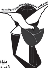
بنیاد شهید و امورایثارگران استان مرکزی