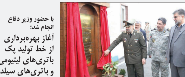
با حضور وزیر دفاع انجام شد:

رئیس‌جمهور دیگری از سخنان خود تصریح کرد: از مجلس شورای اسلامی و مجمع تشخیص مصلحت نظام انتظار داریم با برگزاری جلسات فشرده قانون بوجه را