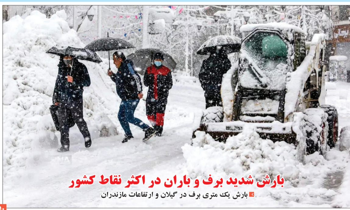
بارش شدید برف و باران در اکثر نقاط کشور

بارش یک متری برف در گیلان و ارتفاعات مازندران