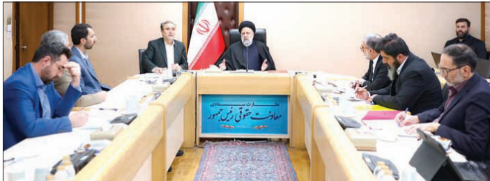
رئیس جمهور در جلسه نظارت ستادی معاونت حقوقی: