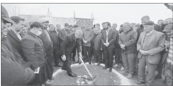
مراسم افتتاحیه پروژه بزرگ ۵۱۵ هکتاری شهرک «ایمان و امید» ملایر