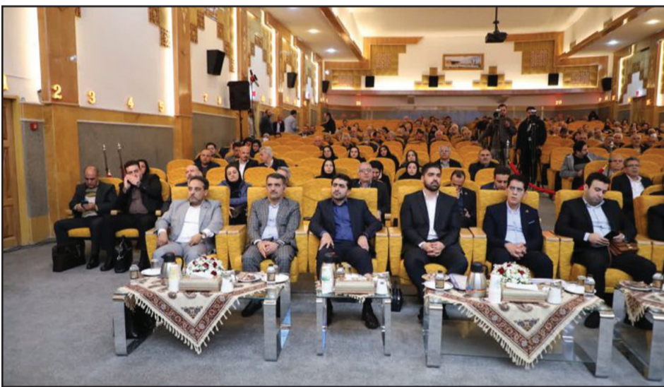
پالایشگاه اصفهان مطابق با استاندارد EP آمریکا است افزود: در برنامه اسفندماه تصفیه ۲۵ هزار لیتر میعانات گازی به صورت