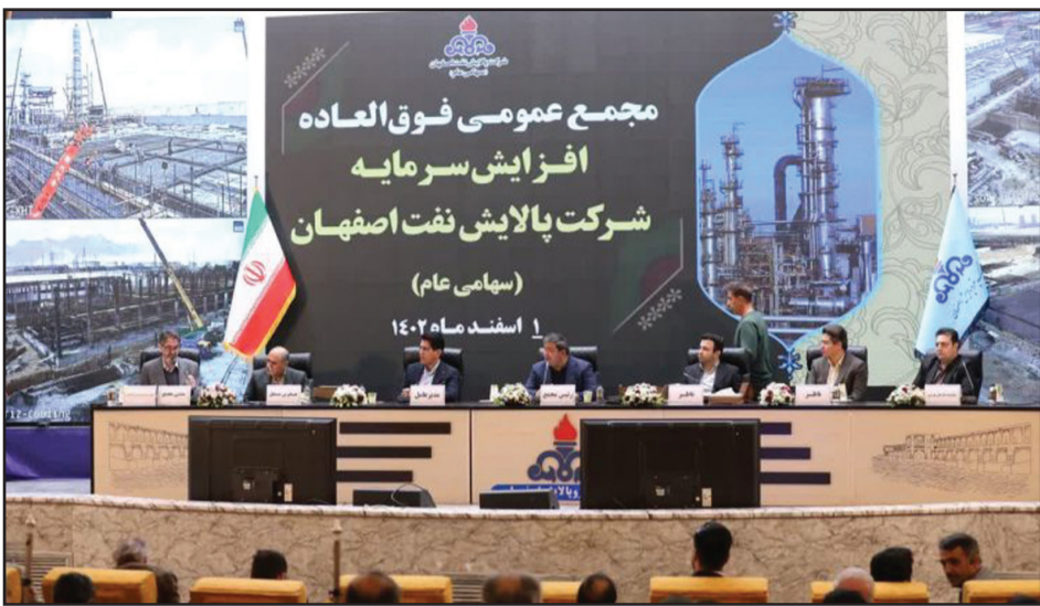
روزانه هدف گذاری شده است.