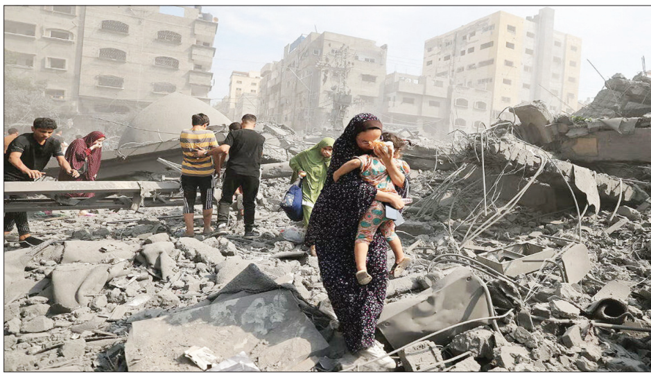
سازمان ملل: تهاجم نظامی به رفح وحشتناک است هیچ محل امنی برای زنان و کودکان فلسطینی در غزه وجود ندارد، حتی «رفح» در جنوب غزه که صهیونیست ها آن را «منطقه امن» خوانده بودند

واکنش ایران به کشیده شدن دامنه جنایت جنگی اسرائیل به رفح