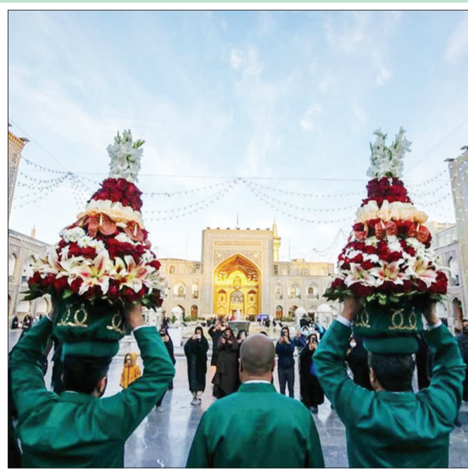
همزمان با ایام ولادت جوادالائمه(ع) روز یکشنبه ۱ بهمن ۱۴۰۲ گل های حرم مظهر رضوی طی مراسمی توسط خادمین حرم امام رضا(ع) تعویض شد

حضرت امام خمینی قدس سره الشریف صحیفه امام - جلد ۱۲ - صفحه ۳۴۳