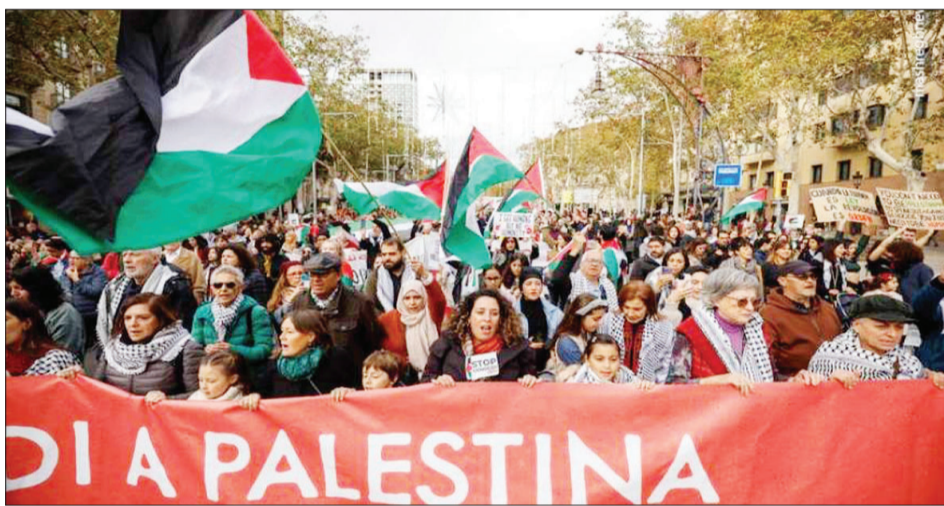
مردم بارسلون و ۱۰۰ شهر دیگر اسپانیا در حمایت از مردم غزه و محکومیت جنایات صهیونیست‌ها به خیابانها آمدند

هشدار صندوق توسعه ملی: از سال ۱۴۲۰ ایران فقط یک سوم نیاز گازی خود را می‌تواند تأمین کند