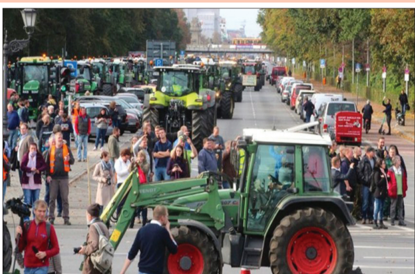
خبابان‌های آلمان زیر چرخ تراکتور رفت؛ اعتراض کشاورزان به افزایش مالیات و کاهش یارانه