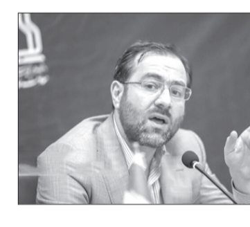
وی با اشاره به کاهش کمبودهای دارویی در ماه‌های اخیر گفت: داروهای وارفرارین و متی مازول داروهایی بودند که طی ماه‌های اخیر با کمبود مواجه بود که خوشبختانه محموله‌هایی از این داروها توزیع شد و محموله‌های بعدی نیز تامین و توزیع خواهد شد.

رئیس سازمان غذا و دارو گفت: تدوین دستورالعمل دارورسانی درب منزل در دستور کار قرار دارد تا بر این اساس داروی سالم از طریق داروخانه زیر نظر داروساز از مسیر سالم به دست بیمار واقعی برسد.