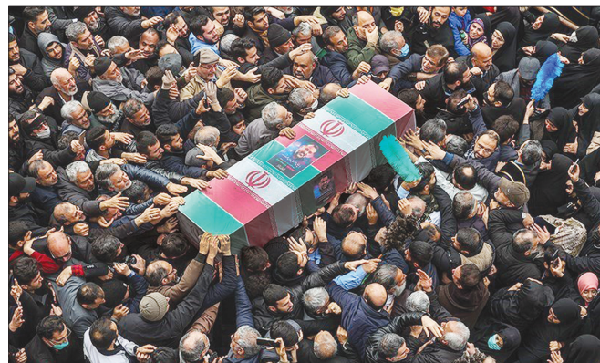
تشییع پیکر سردار شهید سید رضی موسوی در تهران