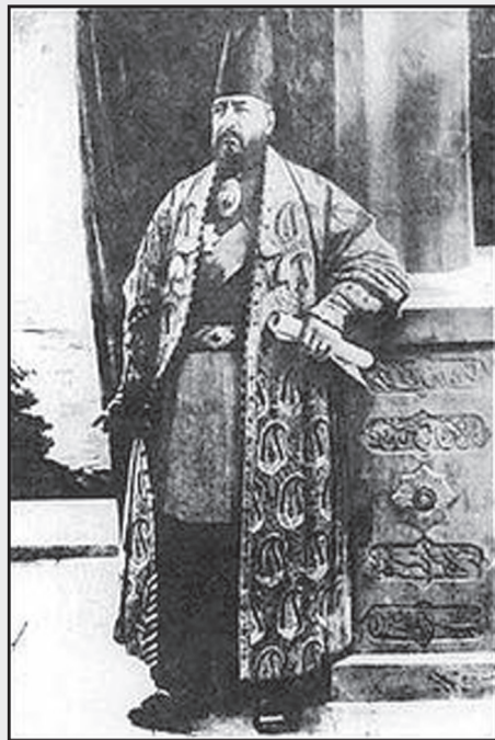
اهم اقدامات امیر کبیر در زمینه مسائل مالی