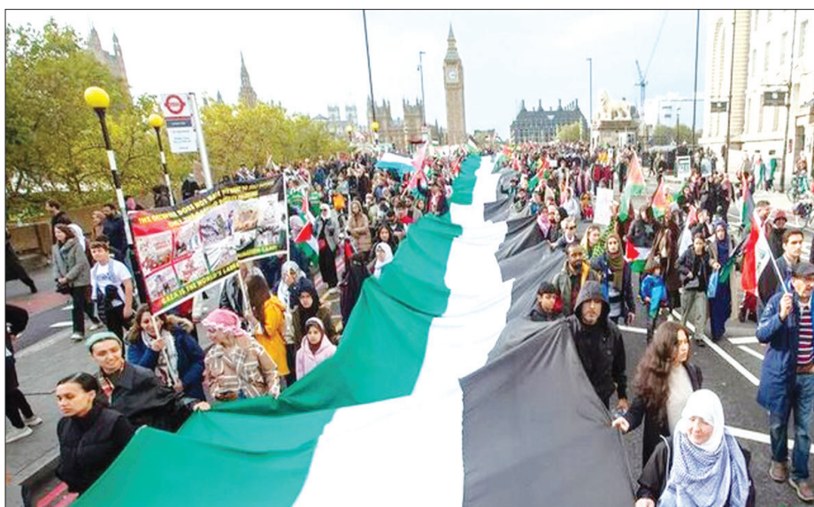
اعتراض به جنگ غزه در سراسر آمریکا و اروپا: