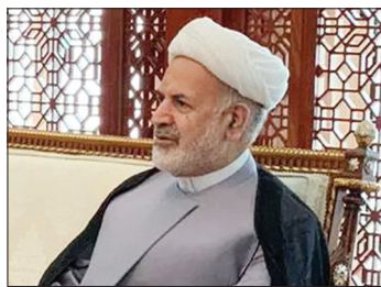
یدنیال برگزاری اولین مجمع عمومی انجمن دوستی ایران و عربستان، حجت‌الاسلام محمدرضا نوری شاهرودی

حجت‌الاسلام محمدرضا نوری شاهرودی در سال ۱۳۶۱ به عنوان نماینده امام خمینی(ره) اولین مسئولیت اجرایی خود را در کویت آغاز کرد، پس از آن نخست به عنوان سفیر جمهوری اسلامی ایران در جماهر عربی لیبی و سپس در کشور عربستان سعودی مشغول به کار شد. نوری شاهرودی همچنین به عنوان مشاور امور بین‌الملل ریاست قوه قضائیه، ریاست قوه مقننه و مجمع تشخیص مصلحت نظام نیز فعالیت کرده است.