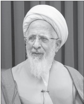
پایگاه اطلاع‌رسانی اسراء: جلسه درس اخلاق فتنگی آیت‌الله العظمی جوادی آملی این هفته نیز در محل مسجد اعظم قم به صورت حضوری و با حضور اقسام مختلف مردم برگزار گردید.

آیت‌الله العظمی جوادی آملی با بیان اینکه کتاب نهج‌البلاغه تالی تلو قرآن کریم است، اظهار داشتند: کلمات نورانی امیرالمؤمنین (سلام‌الله علیه) مثل سایر ائمه (علیهم‌السلام) منسجم و علمی است. ولی سید رضی(رضوان‌الله تعالی علیه) فرصت نکردند که همه کلمات را جمع بکنند و خطبه‌ها یا نامه‌ها یا کلمات نورانی یکجا ذکر بشود. لذا خطبه‌ها و نامه‌ها تقطیع شده و سیاق و سباق کلمات نیامده و این کتاب در حوزه‌ها به عنوان یک مرجع علمی شناخته نشده است، فهمیدن نهج‌البلاغه بدون عامل سابق بدون عامل سیاق این می‌شود که شخصیتی مانند محقق(رضوان‌الله تعالی علیه) از فقهای نام آور شیعه در شرایع می‌گوید «و فی مرسله الرضی»، که این حرف خیلی از عظمت و شکوه این کتاب کم می‌کند؛ مرسله رضی کجا، نهج‌البلاغه علی کجا؟! باید توجه داشت که بیشتر این خطبه‌ها و کلمات دارای سیاق و سیاق هست که در کتاب "تمام نهج‌البلاغه" آمده است و این کتاب تمام نهج‌البلاغه از بهترین برکات است.