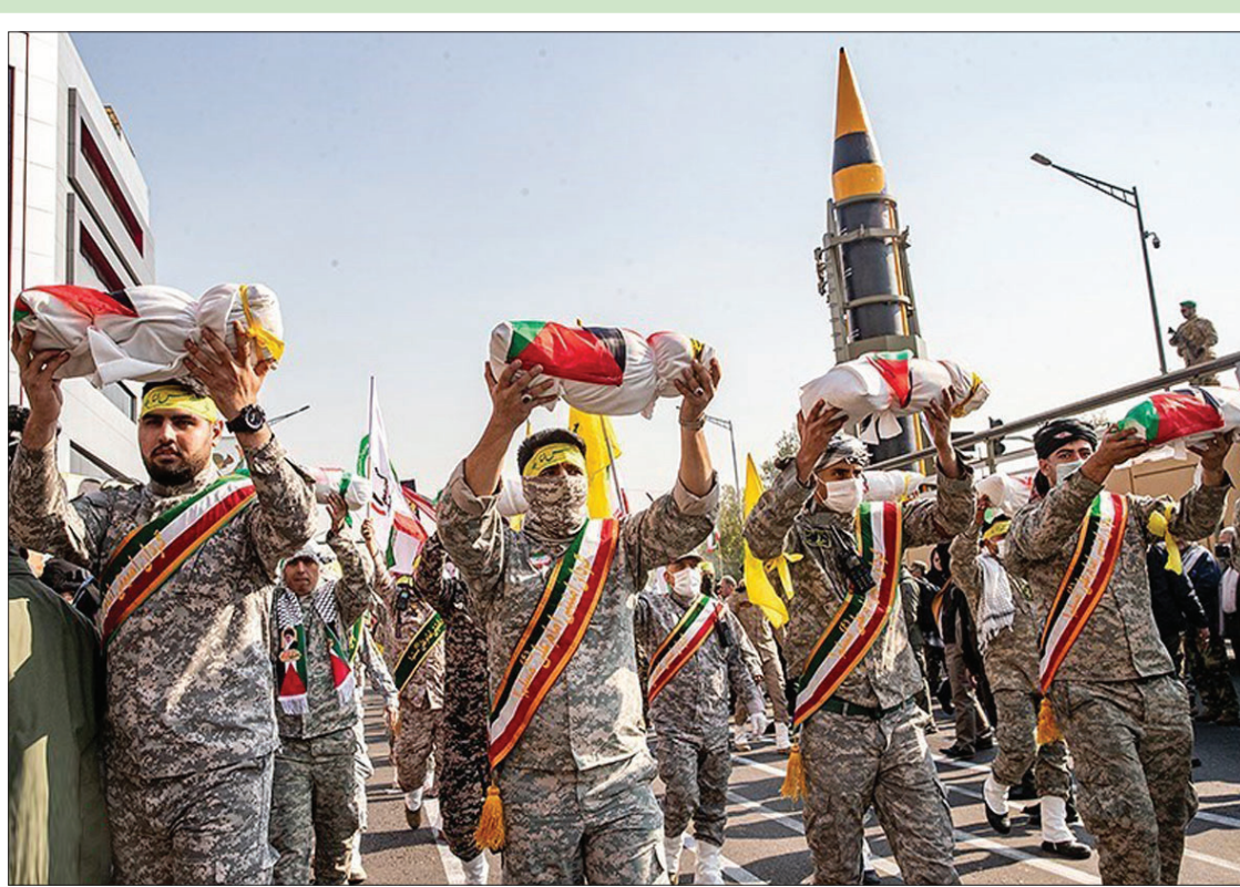
برگزاری رزمایش ۵۰ هزار نفری بسیجیان در تهران به حمایت از مردم مظلوم غزه

یک نماینده مجلس هلند: نتانیاو باید به خاطر کشتن هزاران کودک فلسطینی در دادگاه بین‌المللی محاکمه شود