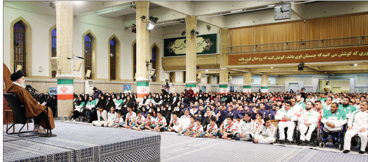
دوری که کوشش می کنید که جستان فوی باشد، کوشش کنید که روحان فوی باشد