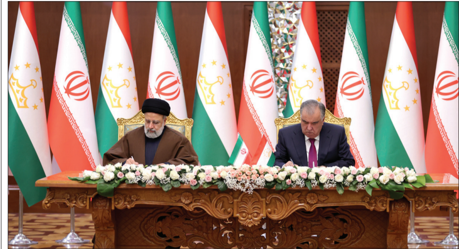
با حضور رؤسای جمهور دو کشور صورت گرفت

نخست وزیر سابق اسرئیل: نتانیاهو از لحاظ روانی نابود شده است