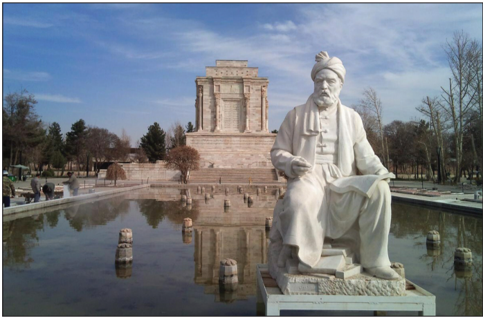
مشهد - خبرنگار روزنامه جمهوری اسلامی: مشهددارمشهد گفت: مدیریت شهری نگاه ویژه‌ای

چند روز قبل تعدادی از ارادال و اوباش در منطقه توس ۹۲ شهر مشهد با تیر و قمه ۲۳ دستگاه خودرو را تخریب و رعب و وحشت ایجاد کردند که طبق اعلام پلیس، هفت نفر تا کنون در این خصوص دستگیر شده‌اند.