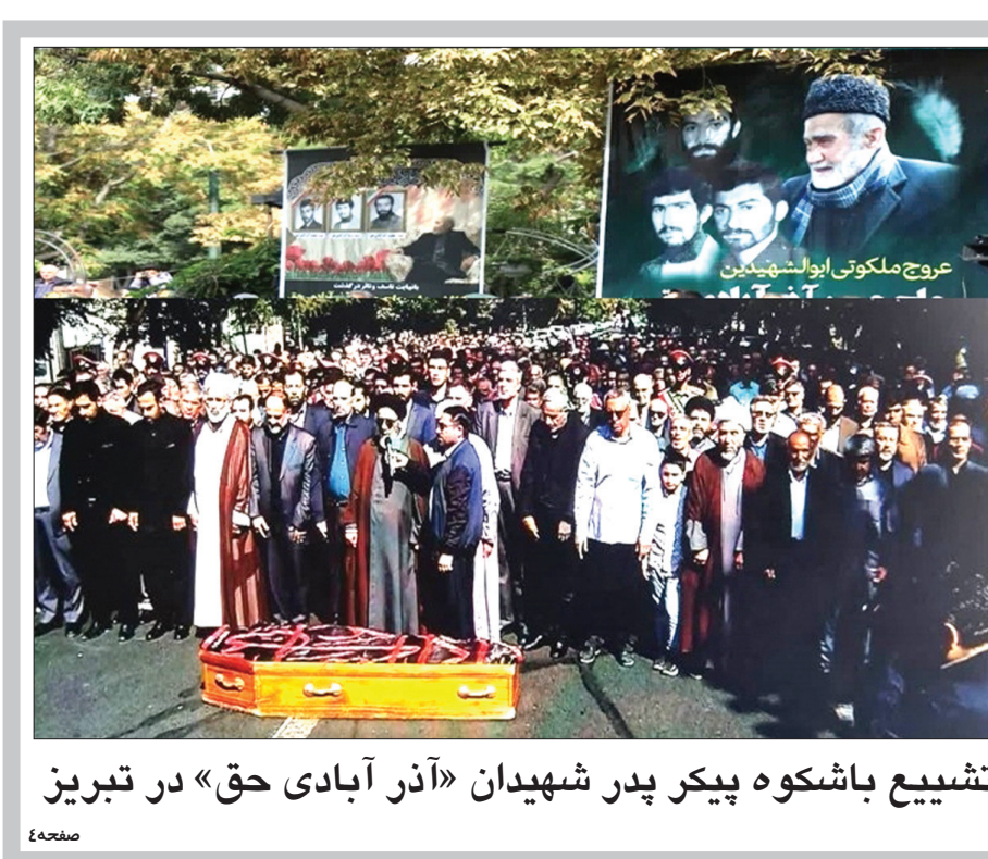
تشییع باشکوه پیکر پدر شهیدان «آذر آبادی حق» در تبریز