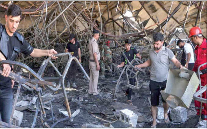
یک نمای هوایی از تونلی جدیدی که صهیونیست‌ها در زیر مسجد الاقصی در بیت‌المقدس حفر کرده‌اند.

تحریک طالبان پاکستان، مسئولیت این حمله را بر عهده گرفت.طالبان پاکستانی گروه جداگانه، اما با طالبان افغانستان متحد است. حملات تشدید شده توسط طالبان پاکستان و سایر گروه‌های تروریستی در سال جاری صدها نفر را