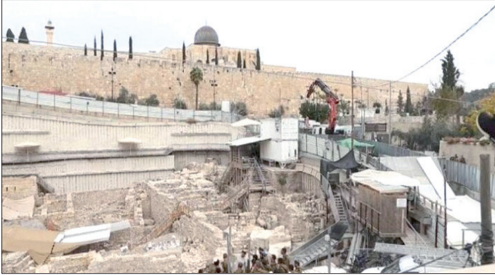
یک نمای هوایی از تونلی جدیدی که صهیونیست‌ها در زیر مسجد الاقصی در بیت‌المقدس حفر کرده‌اند.