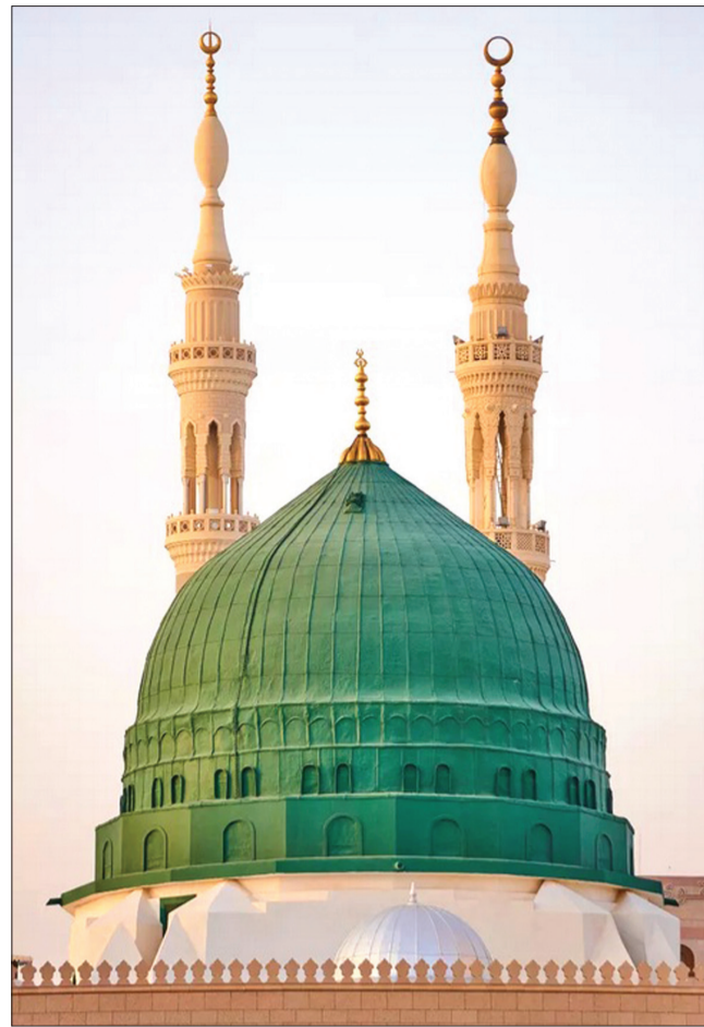
رسول رحمت و منادی وحدت

میلاد خجسته سرور کائنات، پیامبر رحمت حضرت محمد مصطفی (ص) و صادق آل محمد را تبریک می گوئیم