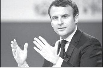
مکرون اظهار کرد: استقلال

راهبردی باید مبارزه اروپا باشد. ما نمی‌خواهیم در مسائلی مهم به دیگران وابسته باشیم. روزی که دیگر انتخابی در مورد انرژی، نحوه دفاع از خود، شبکه‌های اجتماعی، هوش مصنوعی ندارید، دیگر زیرساختی در مورد این موضوعات