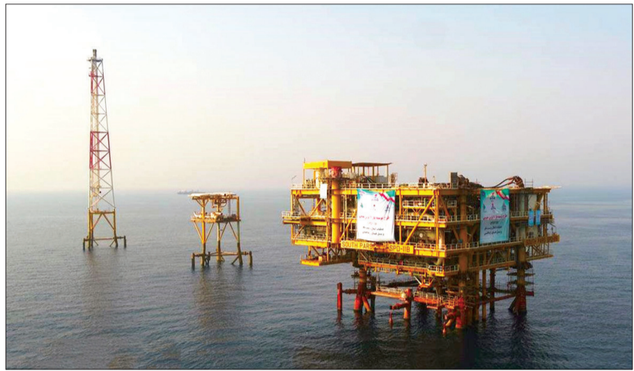
آغاز تولید گاز از فاز ۱۱ پارس جنوبی