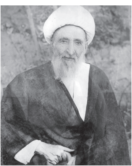
آیت‌الله حاج ملاجواد صافی گلباگانی

کسی که می‌خواهد در این باره چیزی بنویسد، باید به تمام این مطالب دقت و توجه کند. کسی که