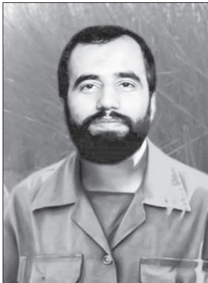
سردار علی هاشمی

سردار علی هاشمی را باید دوباره مرور کرد *نعیم حمیدی اشاره: چهارم تیرماه سالورز شهادت سرلشگر پاسدار حاج علی هاشمی فرمانده اسطوره‌ای قرارگاه سری نصرت و همچنین سپاه ششم امام جعفر صادق(ع) خوزستان است. بی‌شک پرداختن به نقش مؤثر این سردار تاریخ ساز در روند جنگ ۸ ساله و نیز تبیین ابعاد شخصیتی او یک ضرورت انکارناپذیر در راستای معرفی داشته‌ها و سرمایه اجتماعی و الگوسازی برای نسل جوان می‌باشد. علی، عارفی که در اوج شهود، فلسفه چگونگی زیستن را به نسل‌ها آموخت و معرفت را با کردار کریمانه فریاد کرد و تا آخرین لحظات عمر راز سر به مهر انقلاب را گنجینه درون صیقل یافته خود چون لعل نگه داشت و برای پاسداشت آن سر به آستان ولایت تقدیم کرد. هاشمی، اسرار حیات را از منظومه اربعین حدیث مکتب روح‌الله و در مدرسه انقلاب فراگرفت و کنترل افسار نفس، اسفار خود را در سلوک الی‌الله با مکارم اخلاق و تکاپو در میان خلق آغاز کرد.