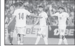
تیم ملی فوتبال ایران در دومین بازی خود در مرحله گروهی مسابقات کافا در ورزشگاه دولان اوموزراکوف به مصاف میزبان گروه دوم یعنی قرقیزستان رفت که این بازی با هت تریک مهدی طارمی و دبل سردار آزمون در نهایت با نتیجه ۵ بر یک به سود ایران تمام شد. شاکردان امیر قلعه‌نویی با این پیروزی پرگل موفق به صدرنشینی در گروه خود و صعود به فینال رقابتها شدند

صعود تیم ملی فوتبال ایران به مرحله نهایی کافا