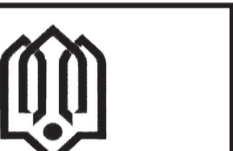
سازمان نوسازی، توسعه و تجهیز مدارس استان تهران اداره کل نوسازی، توسعه و تجهیز مدارس استان تهران

آگهی تغییرات شرکت سهامی خاص برید سامانه نوین به شناسه ملی ۱۰۱۰۲۰۲۰۲۳۴ و به شماره ثبت ۱۵۹۳۳۱ به استناد صورت‌جلسه مجمع عمومی فوق العاده مورخ ۱۴۰۲/۰۳/۰۴ تصمی‌مات ذیل اتخاذ شد: اساسنامه ای مشتمل بر ۶۴ ماده و ۱۱ تبصره تصویب و جایگزین اساسنامه قبلی گردید. سازمان ثبت اسنادواملاک کشور اداره ثبت شرکت ها و موسسات غیرتجاری تهران (۱۵۱۳۳۱۰)