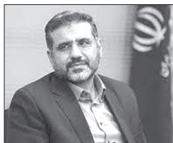
وزیر فرهنگ و ارشاد اسلامی گفت: زبان فارسی از اولویت‌های وزارت ارشاد، ارشاد، نهاد هویت و عامل وحدت در همه جغرافیای فرهنگی ایران از تاجیکستان و ازبکستان تا هند و بنگلادش است.

محمد مهدی اسماعیلی در نشست یک دهه فعالیت بنیاد سعدی، با تأکید بر اهمیت حفظ و صیانت از زبان فارسی گفت: با زبان فارسی توانستیم تاریخ پرافتخار ایران را حفظ کنیم و این سنت بزرگی است که امروز به ما به میراث رسیده است. به دلیل صیانتی که از این زبان شده است، هر کسی زبان فارسی را می‌شناسد، زمانی که گلستان سعدی را باز می‌کند، آن را می‌فهمد و می‌تواند از آن استفاده کند. این خدمت ماندگاری است که بزرگان ما در حوزه فرهنگ و ادب انجام دادند.