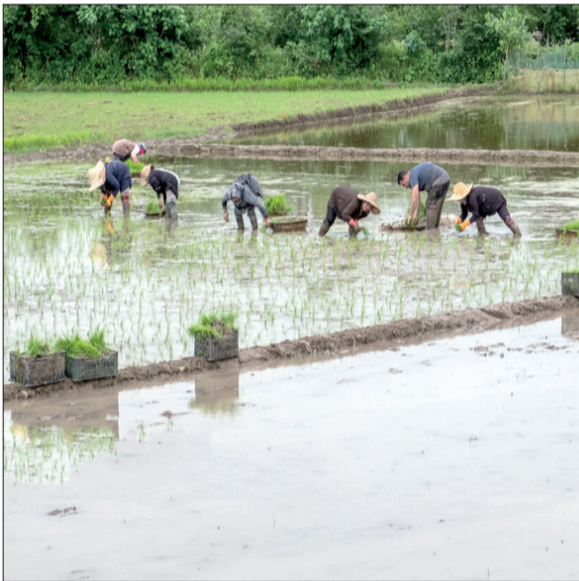
کشاورزان در حال آبیاری زمین‌های کشاورزی در شهرستان آمل