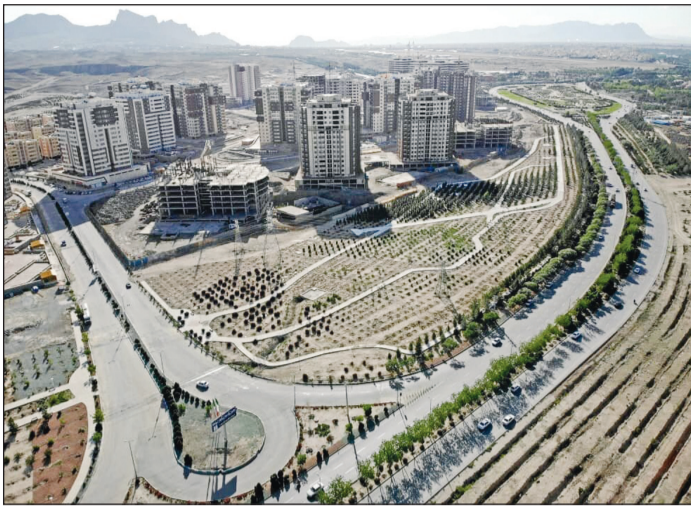
نمای هوایی از شهرک شهید کشوری اصفهان

مدیر کل فرهنگ و ارشاد اسلامی استان اردبیل: