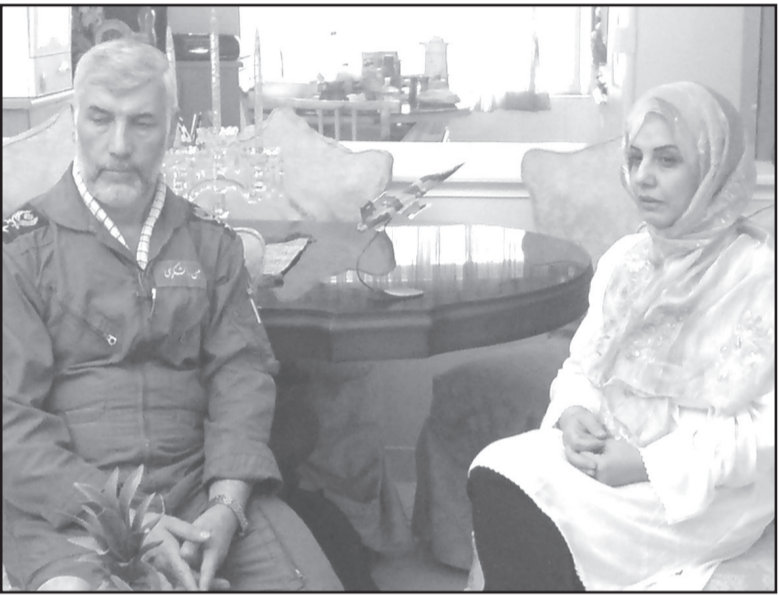
زمین نشستته و پاهایم دراز شده بود. تقریبا موقعیت خودم را شناسایی کردم، متوجه شدم در خاک دشمنم و اسیر شده ام."

پس از گذشت ۲ الی ۳ ثانیه خون به مغزم بازگشت تمام مدتی که این ۲۰ متر راه را طی می‌کنیم آن ابهت و شجاعت یک افسر ایرانی را حفظ کنیم. در ۱۰ متری مرز دو نفر از صلیب سرخ هم به ما اضافه شدند، هر کدام در یک