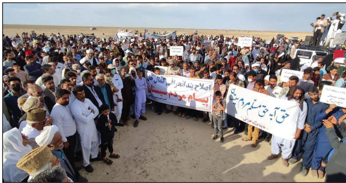
تجمع مردم سیستان در بستر خشکیده تالاب هامون برای مطالبه «حق آبه هیرمند»