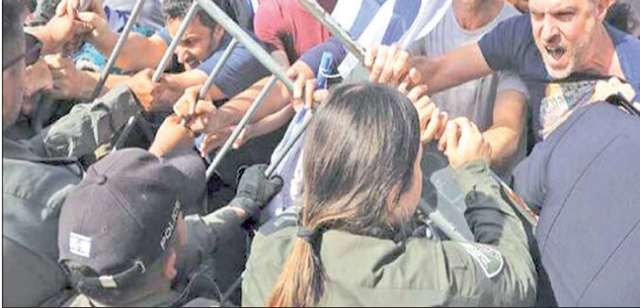
تظاهرات در بغداد در جریان اعتراضات ۲۰۱۹

در این سند آمده است: داعش برای عملیات‌های خارجی که به منابعی خارج از خاک افغانستان، عامل‌هایی در کشور هدف و شبکه‌های گسترده نیاز دارند، یک مدل با هزینه پهنه تدوین کرده است. این مدل به داعش کمک می‌کند تا از مواعی مانند سرویس‌های امنیتی توانمند گذر کرده و زمانبندی عملیات‌ها را کاهش دهد که موجب کاهش احتمال بروز اختلال در عملیات‌ها خواهد شد. دیگر گزارش‌های اطلاعاتی فاش شده نشان می‌دهند که تروریست‌های داعش در دیگر نقاط جهان به دنبال دستیابی به تخصص ساخت تسلیحات شیمیایی و استفاده از پهپادها هستند. آن‌ها همچنین ممکن است دیپلمات‌های عراقی را در فرانسه یا بلژیک گروگان بگیرند تا ۴۰۰۰ زندانی داعشی را آزاد کنند.