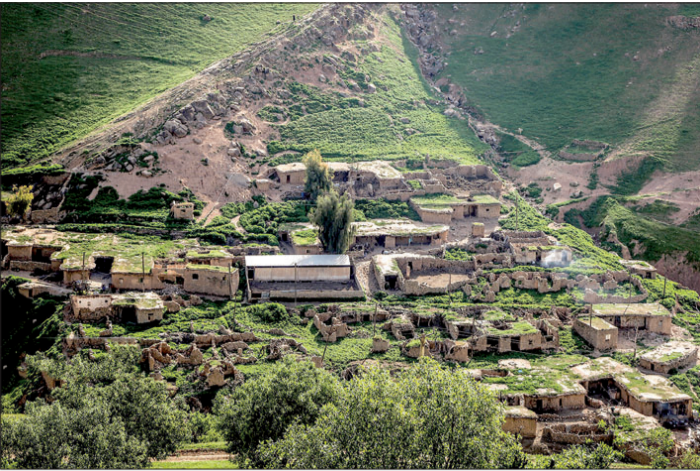
خانه‌های شمال تهران در فصل بهار.