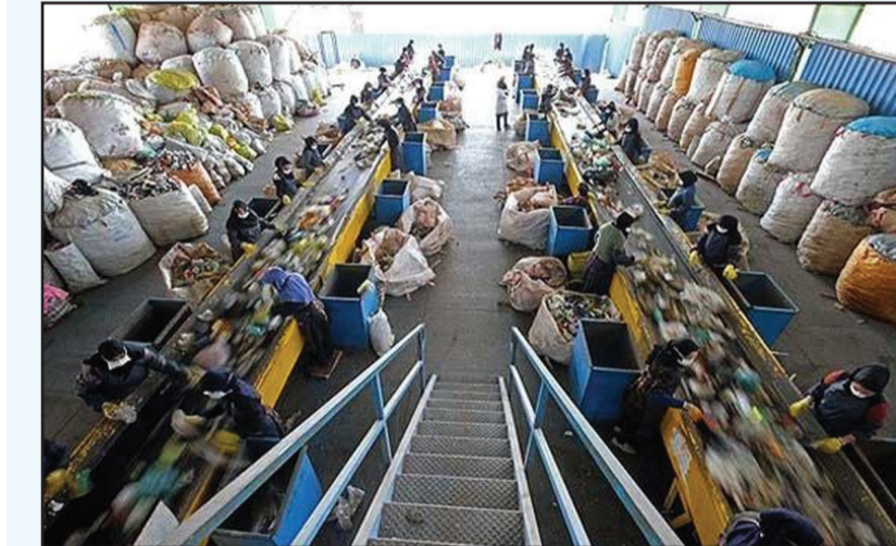
امارات نیز به یک منبع انرژی جایگزین و سوخت حاصل از زباله تبدیل شده و قادر است که به جای سوخت در کارخانه‌های سیمان مورد استفاده قرار گیرد.

مستندات، برای بار اول در صورتی که فرد اعلام کند که اشتباهی برایش پیامک آمده است این موضوع را می‌پذیرد اما در صورت تکرار و برای بار دوم، دیگر چشم پوشی نخواهد کرد. همچنین سردار احمدرضا رادن، فرمانده فراجا در واکنش به درصد خطای دوربین‌هایی که قرار است در طرح برخورد با افرادی که کشف حجاب کرده‌اند استفاده