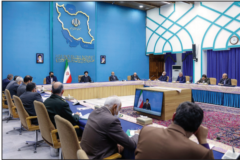
۱۰ روز فرصت داد تا اگر درباره عملکرد قرارگاه‌های ستاد جوانی جمعیت نظر یا پیشنهادی دارند، اعلام کنند. بخش‌های پژوهشی دستگاه‌های اجرایی نیز مکلف شدند

رئیس جمهور همچنین به دستگاه‌های مختلف اجرایی