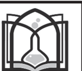
دانشکده علوم پزشکی تربیت مدرس، تهران، ایران

۶. کلیه شرکت‌کنندگان در مناقصه می‌بایست علاوه بر ارسال مدارک بصورت الکترونیک در سامانه ستاد، پاکت «الف» حاوی تضمین را حداکثر تا ساعت ۸ صبح مورخ ۱۴۰۱/۱۲/۲۵