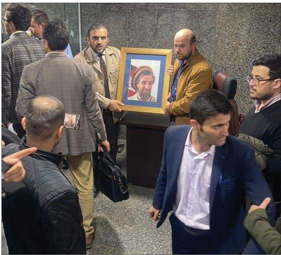
همزمان با تحویل دادن سفارت افغانستان در تهران به طالبان، عکس احمد شاه مسعود، نماد مبارزه مردم افغانستان علیه اشغالگران، هم از سفارت بیرون برده شد