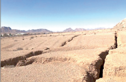
رئیس سازمان نقشه‌برداری همدار داد: نرخ فرونشست زمین در ایران ۵ برابر متوسط دنیا

رئیس سازمان نقشه‌برداری با بیان اینکه ۳۵۰ شهر کشور فاقد نقشه فرونشست هستند، گفت: با اعتبارات وصول شده قرار است با ظرفیت بخش خصوصی و پهیاده‌ا اقدام به تهیه نقشه‌ها شود.