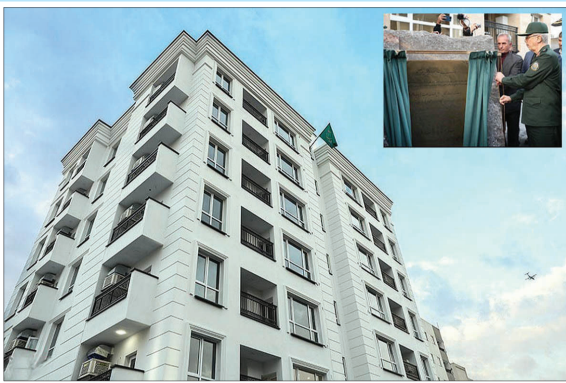
بهره برداری از ۱۳ هزار واحد مسکونی سازمانی نیروهای مسلح

رئیس هیات مدیره اتحادیه صادرکنندگان فرآورده‌های نفتی اعلام کرد: