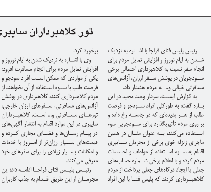
رئیس پلیس فتای فراجا با اشاره به نزدیک شدن به ایام نوروز و افزایش تمایل مردم برای انجام سفر نسبت به کلاهبرداری احتمالی برخی سودجویان در پوشش سفر ارزان، آژانس‌های مسافرتی خیالی و… به مردم هشدار داد.