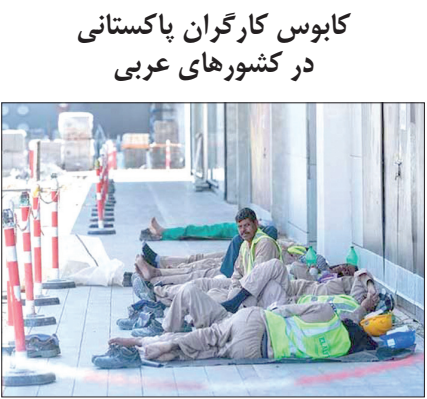
جهان و رسانه